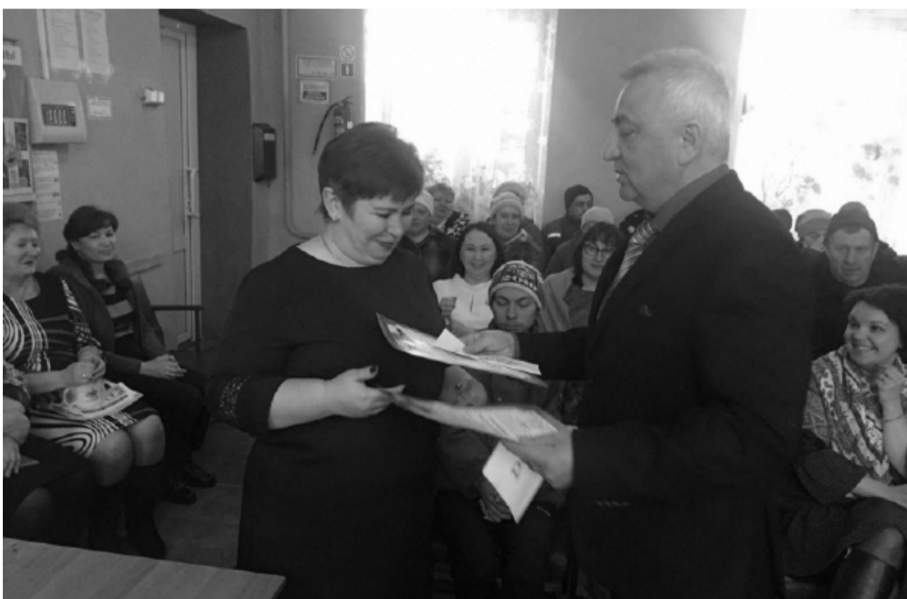
В администрации района

работники коммунального хозяйства, во многом определяет не только внешний вид и благоустройство нашего города, но и условия жизни и быт духовщинцев, а потому огромное спасибо всем работникам коммунальной сферы за их нелёгкий труд.